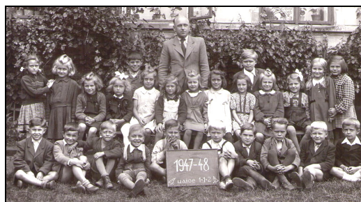
Žáci, kteří nastoupili do školy v roce 1945 - 1946 a 1947 - 1948.

Veleňáček, zpravodaj Kulturně - historického sdružení Malé Veleně, Jedlky a Soutěsky, o. s. * www.mala-velen.estranky.cz