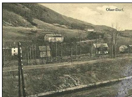
Soutěsky – pohlednice byla odeslána v roce 1934.

Pohlednici vydalo nakladatelství Zschke Zautig ( Soutěsky ), které sídlilo pod názvem Skizza v domě č.68 v Malé Veleni ( domek u železnice u elektrárny ).