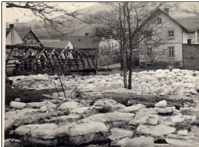
Odstřel ledu v Soutěskách – 1954. Fotografie zaslala Zdena Janková z Brna

Veleňáček, zpravodaj Kulturně – historického sdružení Malé Veleně, Jedlky a Soutěsky, o. s. * www.mala-velen.estranky.cz e-mail: mala-velen@seznam.cz * Odp. redaktor : Jaroslav Dostál, Malá Veleň 29 * Tel: 607 583 271 * Tisk: Milan Dostál Členové redakce: M. Hurt , Fr. Stibor * Foto archiv * Povoleno MKČR reg. číslo : E 18183 * Náklad: 50 výtisků * Redakce neodpovídá za obsah podepsaných článků * Neprodejné * Uzávěrka dalšího čísla je 20. 11. 2011 * Toto číslo vyšlo 15. října 2011