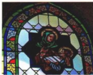
Svatá Anna na nově vytvořené okenní vitraji

Pověst vypráví, že v místě, kde se nyní nachází chrámová loď, stávala kdysi sílná jedle. Ta počívala kvůli svým bílým šiškám zoldátní úcty. Pod ní se později shromažďovali lidé získaní ke křesťanské víře a nasloužili bohoslužbám, které byly vedeny v prosté dřevěné kapli. V této době (19. století)