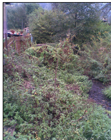
Před čištěním potoka – pohled na udržované i neudržované části potoka.