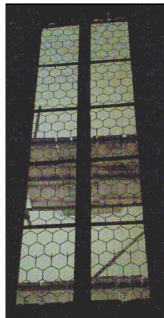
Vlevo okno vedle oltáře před rokem 1909, uprostřed okno bez výplně, vpravo nová vitráž.