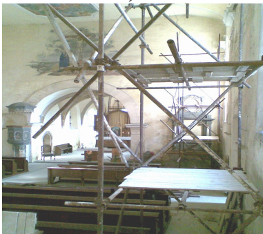
Lešení v kostele pro opravu oken

Tel.: 607 583 271., č. účtu u ČSOB 6699, kód banky 0300, specifický symbol 0023 147 988