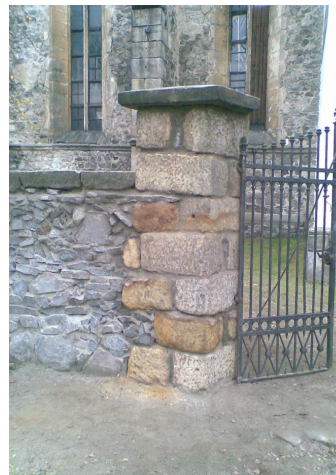
Opravený pilíř a zeď u kostela