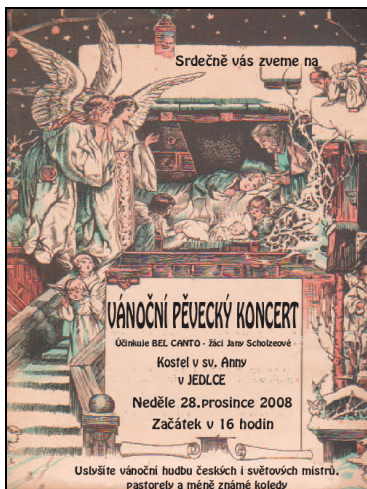
Pozvánka na koncert

Krásné prožití vánočních svátků, hodně radosti, spokojenosti a dobré pohody v novém roce přejí členové Kulturně – historického sdružení.