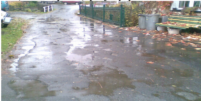
Opravená komunikace za 130.000,- Kč v Malé Veleni u č.76