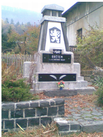
Opravený pomník v Jedlce