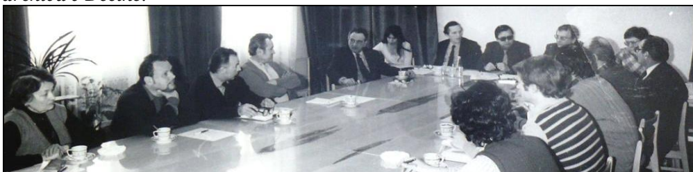
Rada Městského národního výboru v Benešově n. Pl. v době, kdy jsme byli integrovanou obcí – rok 1986.

Pozn.: Pamětní kniha Sboru pro občanské záležitosti s podpisy a fotografiemi je uložena ve Státním archivu v Děčíně.