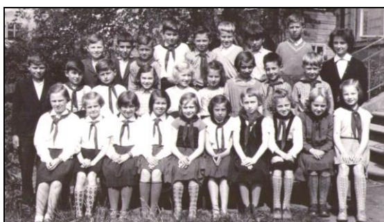
Žáci naší školy před 60 lety, v roce 1960... jak ten čas utíká.