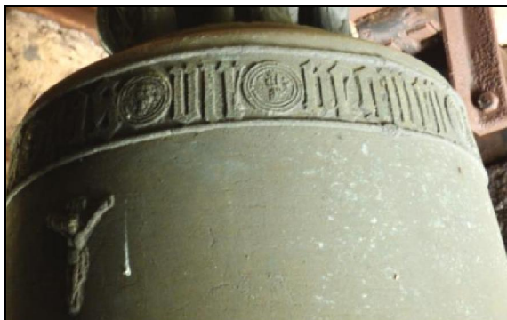
Nejstarší zvon v kostele v Jedlce.