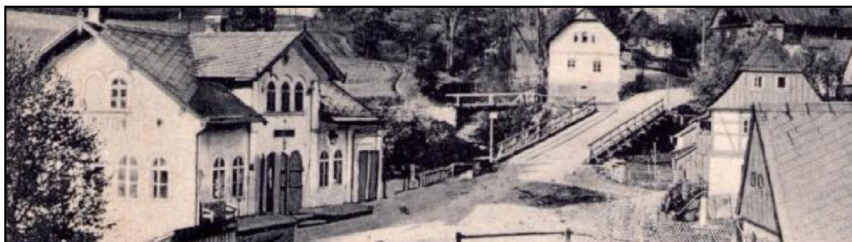
Budova pivovaru vpravo za štítem přední střechy. Vlevo je bývalá hospoda a dřevěný most.

Výstavba pivovaru je datována kolem roku 1650 společně s dalšími budovami, kde bydleli sládkové a pracovníci pivovaru. Velká část objektů, které patřily k pivovaru, byla zbourána při stavbě železnice (1867 – 1869). Některé domy správa dráhy nechala postavit znovu. č. 33, 34, 50 a 76). Musel také být vybudovaný most přes údolí vzniklé při budování železnice a změnil se i trasy místních cest. Největší budova pivovaru (na snímku dole je vidět za štítem střechy domu č. 35 u Ploučnice) byla zbourána až po roce 1945.