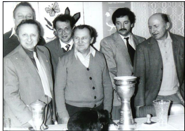
Text a fotografie z týdeníku Jiskra v srpnu 1985