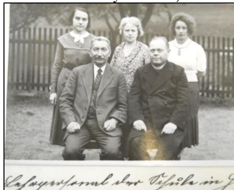
Nově postavená škola v Jedlce a učitelský personál školy – 1920