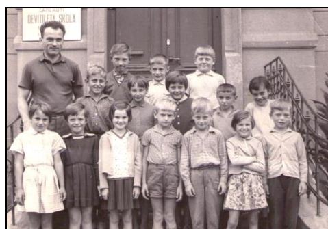
Poslední ředitel zdejší školy s dětmi.

Pozn.: Do kopie kroniky školy, kde jsou i vloženy fotografie, je možné nahlédnout. Kontakt v tiráži.