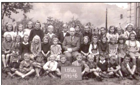
První ředitel české školy s dětmi, školní rok 1945/46.

V dřívějších dobách, kdy ještě nebyla autobusová doprava tak rozšířena, jezdily děti do školy v Benešově n. Pl. většinou vlakem ze zastávky v Malé Veleni.