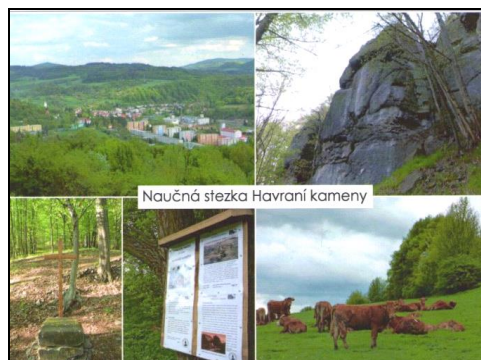
Turistickou stezku prošly a kostel v polovině května navštívily i důchodkyně z Děčína. Vpravo nově vydaná pohlednice „Naučná stezka Havraní kameny“. Je možné zakoupit při prohlídce kostela.