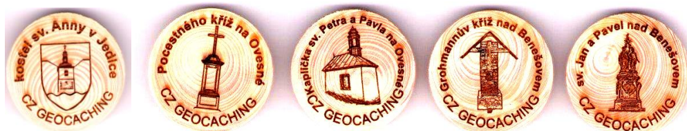
Zájemci o geocaching najdou na trase naučné stezky zajímavé úkryty pro „kešky“.