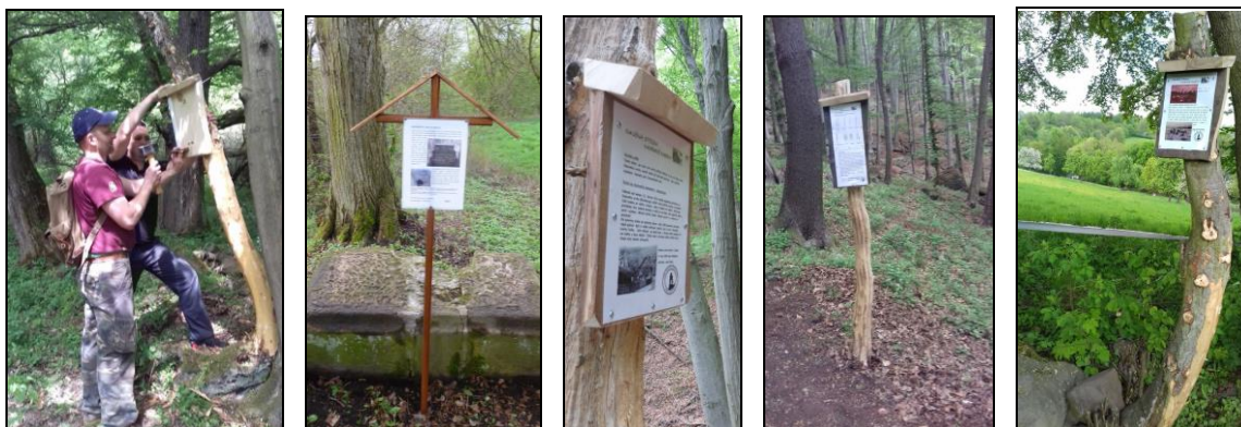
Turistická naučná stezka Havraní kameny končí na železniční zastávce v Malé Veleň. Na trase jsou zabudovány informační tabule. Stezka většinou kopíruje původní vozovou cestu z Jedlky do Ovesné.