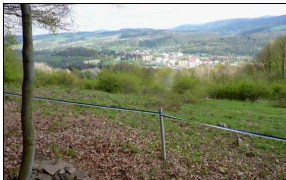
Práce na úpravě turistické stezky a vyhlídka na město Benešov n. Pl.