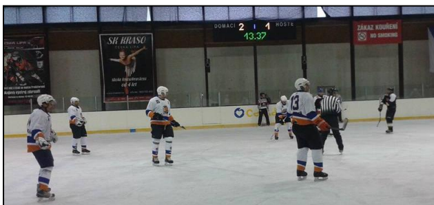
Autobusová zastávka v Jedlce