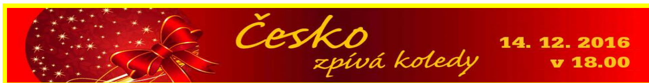
Také letos si společně zazpíváme koledy v kostele v Jedlce.