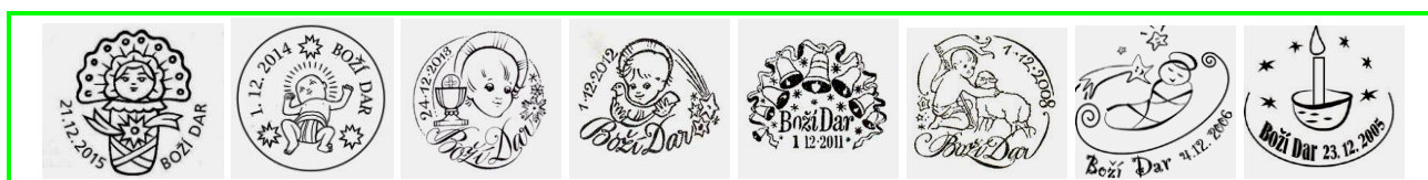
Ukázky poštovních razítek Ježíškovy pošty z minulých let

Poštovní známky i poštovní pohlednice kostela můžete zde zakoupit.