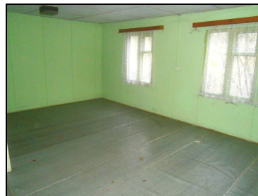
Poslední pohled do chaty chovatelů před vystěhováním a po vystěhování.

Veleňáček, zpravodaj Kulturně – historického spolku Malá Veleň * www.mala-velen.estranky.cz * e-mail: mala-velen@seznam.cz Odp. redaktor : Jaroslav Dostál, Malá Veleň 29 * Tel: 607 583 271 * Tisk: Milan Dostál * Členové redakce: Milan Hurt, František Stibor, Petra Koláčková, Michal Kober * Foto archiv * Povoleno MKČR reg. číslo : E 18183 * Náklad: 80 výtisků * Neprodejné Redakce neodpovídá za obsah podepsaných článků * Uzávěrka dalšího čísla je již 13. 2. 2016 * Toto číslo vyšlo 20. ledna 2016