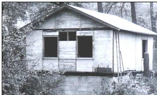
Chovatelé stavěli tuto chatu v roce 1980...