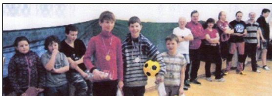
Fotografie je z loňského ročníku Mikulášského turnaje.

Pozvánka na 12. Mikulášský turnaj ve stolním tenise, který se koná na sále kulturního domu v Malé Veleni – Jedlce v sobotu 6. prosince 2014 od 9 hod. Soutěž mládeže, amatérů, seniorů, děvčat i žen. Startovné 30,- Kč. Informace na tel.: 737 432