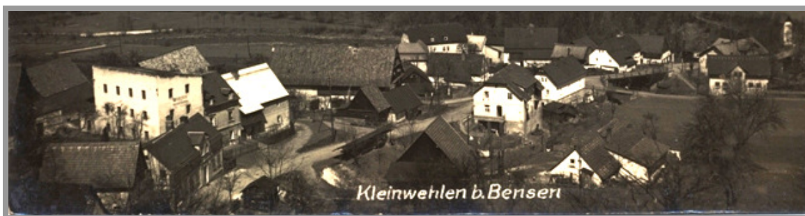
Snímek Malé Veleň kolem roku 1930. Levá část snímku se hodně změnila. Na místě, kde vidíme bílou budovu (starý mlýn) dnes stojí transformátor.